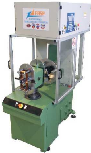
AVVOLGITRICE COIL WINDING MACHINE modello / model "G1" PAVESI