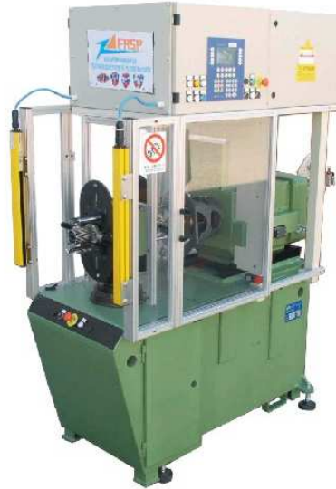
AVVOLGITRICE COIL WINDING MACHINE modello / model "G2" PAVESI