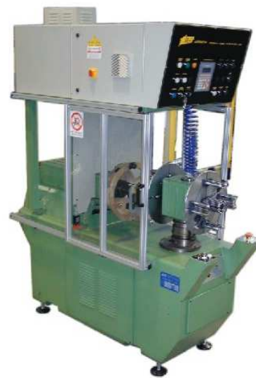
AVVOLGITRICE COIL WINDING MACHINE modello / model "FBC2" MAGNAGHI

F.A.S.P. AUTOMAZIONI INDUSTRIALI - Montecchio Maggiore (VI) ITALY tel 0444-499039 - fax 0444/499048 e-mail info@faspautomazioni.com - sito www.faspautomazioni.com