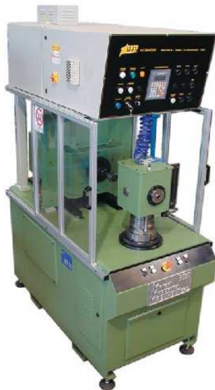
AVVOLGITRICE COIL WINDING MACHINE modello / model "FBC1" MAGNAGHI