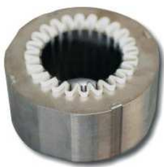
PRODOTTO LAVORATO WORKED PRODUCT