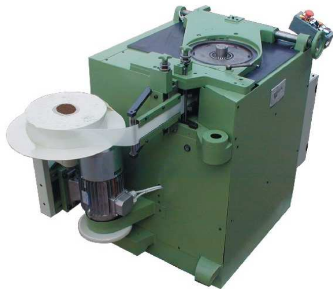
ISOLATRICE FONDO CAVA SLOT BOTTOM INSULATING MACHINE modello / model "STATOMAT"

F.A.S.P. AUTOMAZIONI INDUSTRIALI - Montecchio Maggiore (VI) ITALY tel 0444-499039 - fax 0444-499048 e-mail info@faspautomazioni.com - sito www.faspautomazioni.com