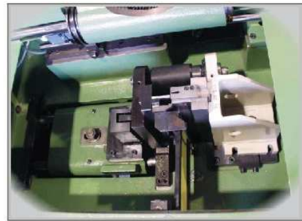
ATTREZZATURA CON DISPOSITIVO DI CAMBIO RAPIDO TOOLING WITH QUICK CHANGE