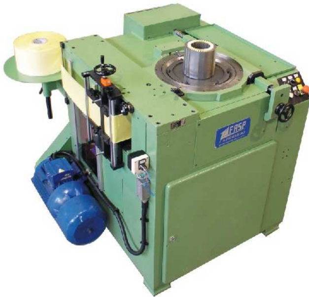
ISOLATRICE FONDO CAVA SLOT BOTTOM INSULATING MACHINE Modello / model "PAVESI"